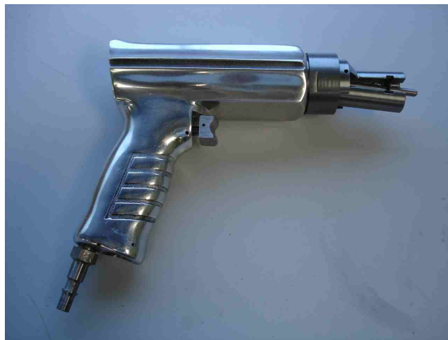
Présentation du travail

Cette pince sert à resserrer les tubes d'échangeurs en cuivre pour préparer le brasage d'une canule de plus petit diamètre. Effort de serrage 1750 N environ.