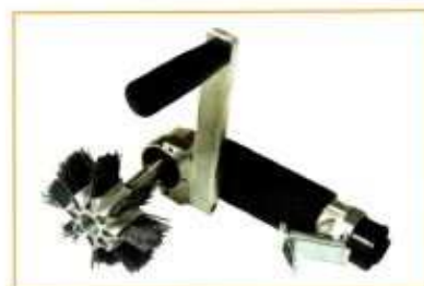
MRA131 décapeur (sans protecteur)