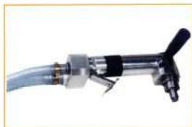
MRA130-6SM sous marine