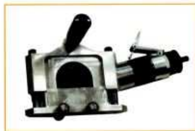
TRA tronçonneuse à rouleaux disque Ø 125 mm - coupe 0 à 20 mm