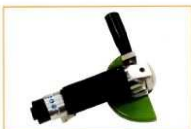
MRA131 option fausse poignée (à gauche ou à droite)