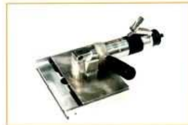
MRA130 tronçonneuse horizontale pour aluminium fraise-scie Ø 125 mm à plaquettes carbure coupe 0 à 10 mm