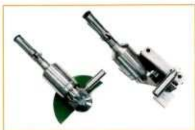
MRA230 -- fraiseuse portative pour fraise Ø 125 mm à plaquettes carbure (fraisage 10 x 10 dans l'aluminium)