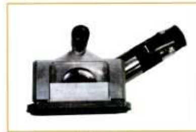
FRA fraiseuse à patin fraise Ø 100 mm - épaisseur 8 mm - coupe 0 à 10 mm

MAJ : 02.08 Vérif. : N.P.L Appr. : C . P