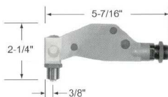
H753A-456 Right Angle