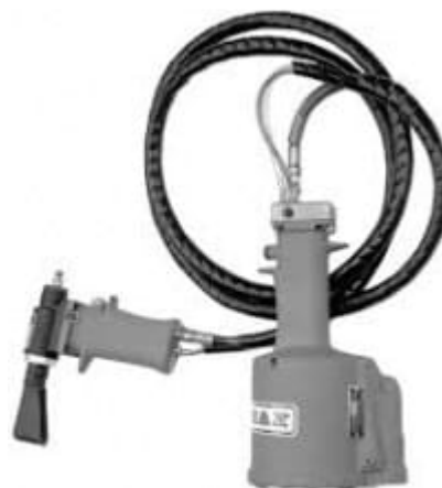
G704B-40SH Avec flexible de 2 m

Ces deux outils ont les caractéristiques de l'outil G704B.