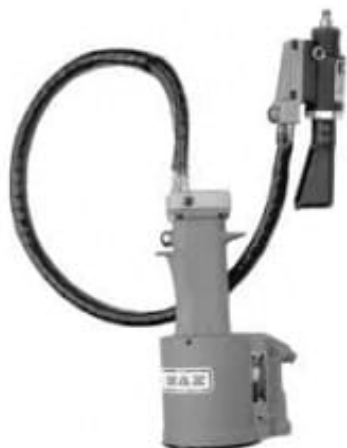
G704B-SR Avec flexible de 0,8 m