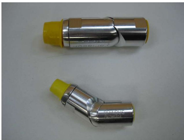
Raccords pour autres fluides (en comparaison avec raccords air comprimé)