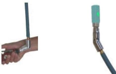
Raccords pour air comprimé

Les raccords orientables peuvent être placés aussi bien au raccordement de l'outil qu'au niveau du raccord rapide.